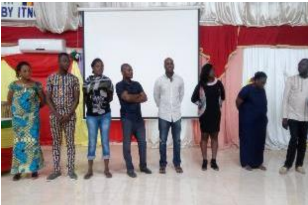
Photo 5 : Directeurs et Vice-Directeurs des secteurs, retenus par leurs pairs après le coworking