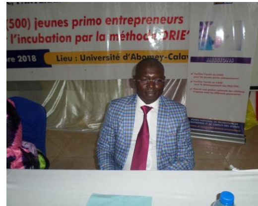
Photo 6 : DG FNPEEJ lors du lancement de la séance de coaching