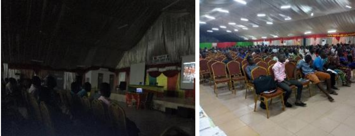
Photo 20 et 21 : Projection du film « Facing of giant » aux incubés de Cotonou

Compétence , les participants suivirent le film : « facing of giant » avant d'être soumis à un exercice lié au contenu dudit film.